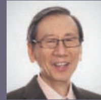
IS-SUR DAVID K L MA Singapor