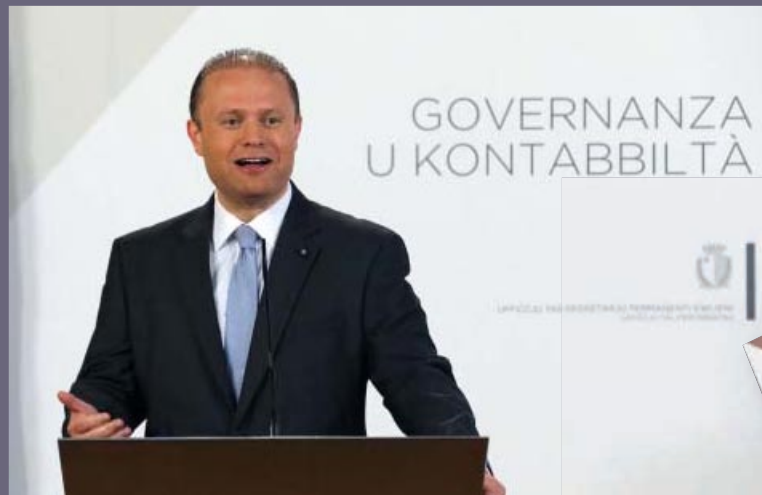
Il-Prim Ministru Dr Joseph Muscat waqt konferenza tal-aħbarijiet li nediet il-pubblikazzjoni Governance - Action on the NAO's Annual Report 2014

Din il-pubblikazzjoni hija evidenza tal-kontabbiltà u t-trasparenza li l-Amministrazzjoni Pubblika qed timxi bihom.